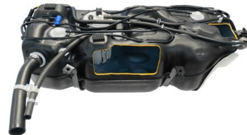
Tuberías de aireación

Todas las actividades de la Química de Repsol están certificadas con la norma de calidad ISO 9001. Los complejos industriales cumplen la ISO 14001, ISO 50001 y la OSHAS 18001 [Occupational Health and Safety Assessment Series]