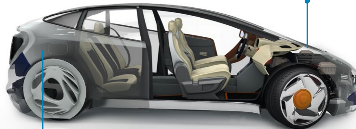
Depósito de carburante

Todas las actividades de la Química de Repsol están certificadas con la norma de calidad ISO 9001. Los complejos industriales cumplen la ISO 14001, ISO 50001 y la OSHAS 18001 [Occupational Health and Safety Assessment Series]